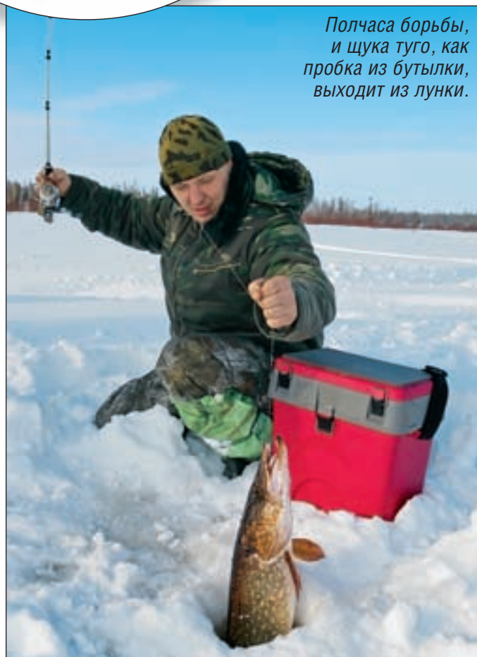
Полчаса борьбы, и щука туго, как пробка из бутылки, выходит из лунки.

Бокоплав (по местному «ковшук») составляет основу здешней кормовой базы, им питаются рыбы многих видов. Бокоплава много и в ручьях с чистой водой, и в заболоченных озерах, причем здесь он встречается разного размера и цвета, от черного до красного.