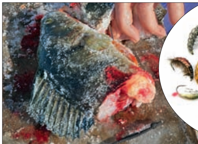
Почти под метровым слоем льда, присыпанным глубоким слежавшимся снегом, вкус крови притягивает зачарованного хищника.

ем. Для этого сверлим лунки то ближе к берегу, то на свале в глубину. На лесных ламбушках, которых здесь немало, окунь отличается не только расцветкой, формой тела, размером спинного плавника, но и пищевыми пристрастиями. Что было востребовано на предыдущем водоеме, на новом не вызвало интереса у хищника. Иногда выручала подсадка на крючок рыбьего глаза, но лучше всего работала полоска замороженной печени. И это объяснимо. Почти под метровым слоем льда, который еще и присыпан глубоким слежавшимся снегом, видимость минимальная, а запах крови хорошо привлекает хищника, действуя более целенаправленно, чем размер, цвет и игра приманки. Неизбежная местная щука иногда настолько жадно хватала насадку, что ее можно было вытащить на лед даже без крючка и багорика.