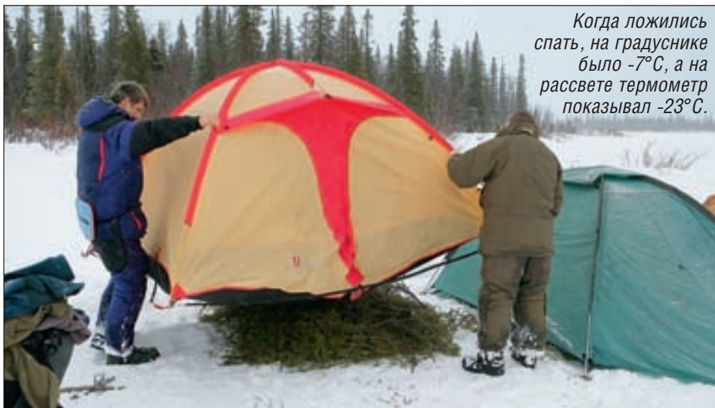
Когда ложились спать, на градуснике было -7^{\circ}\text{C} , а на рассвете термометр показывал -23^{\circ}\text{C} .

Рука уходит почти по плечо. Ледяная вода неприятно обжигает тело. А где-то там, в глубине, лениво шевелится зубастый монстр.