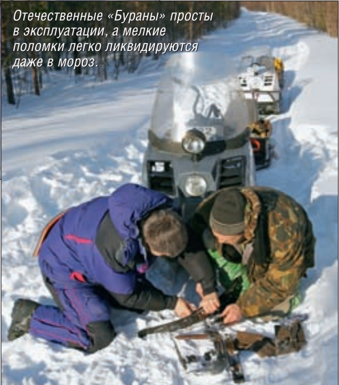
Отечественные «Бураны» просты в эксплуатации, а мелкие поломки легко ликвидируются даже в мороз.

№ 3 с алыми точками на лепестке. Первый хариус оказался настолько бойким, что в лунку его удалось завести только через несколько минут, преодолев отчаянное сопротивление. Затем был еще один и еще. Постепенно все стягиваются к лунке счастливого, стараясь повторить его успех. Но везет далеко не всем. Шум ледобуров